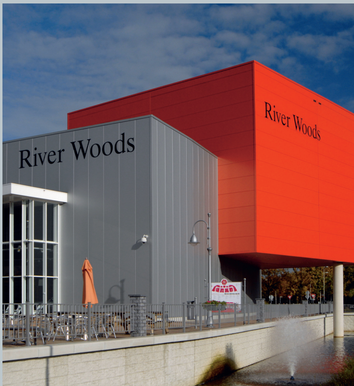
Kingspan-panels op Rosada Factory Outlet.